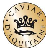
noir sur support doré