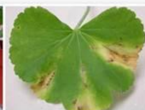
Bactérie ( Xanthomonas )