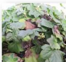
Champignons ( Botrytis )