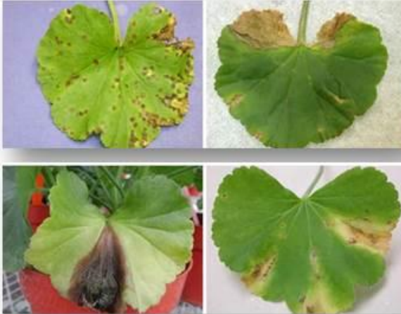
Bactérie ( Xanthomonas )