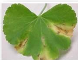
Bactérie ( Xanthomonas )