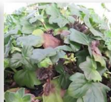
Champignons ( Botrytis )