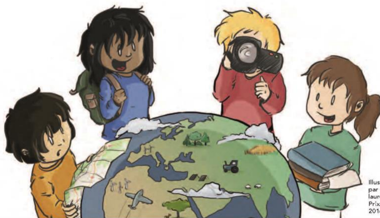
Illustration réalisée par Camille Lévêque, lauréate du Prix ALIMENTERRE 2016

VALORISE LES INITIATIVES DES JEUNES EN FAVEUR D'UNE AGRICULTURE ET UNE ALIMENTATION DURABLES ET SOLIDAIRES !