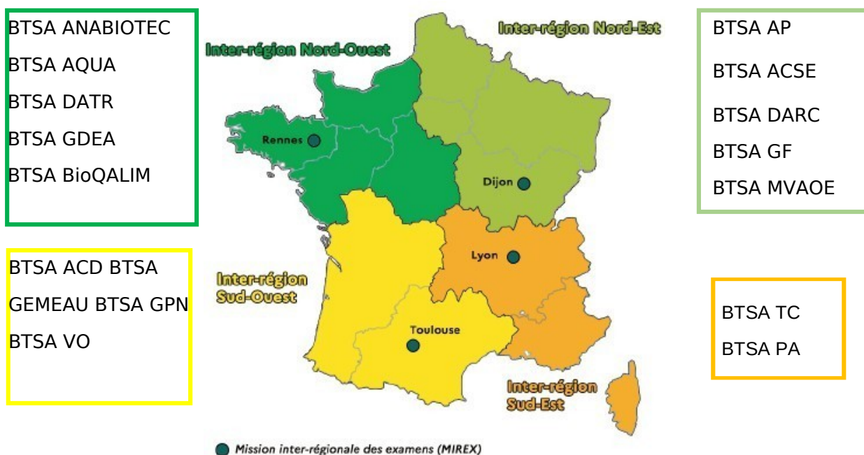
Carte de répartition des MIREX référentes pour les spécialités de BTSA

Les quatre MIREX métropolitaines se répartissent le rôle de MIREX référente pour les spécialités de BTSA selon le tableau ci-dessous.