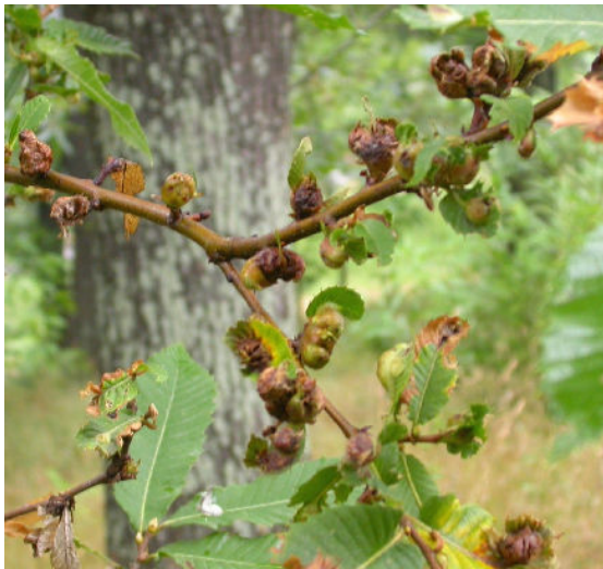
Galles desséchées après l'envol des cynipis adultes