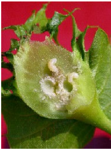
Coupe d'une galle avec larves et loges de développement des larves