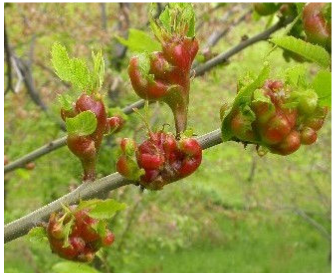
Galles en formation au printemps