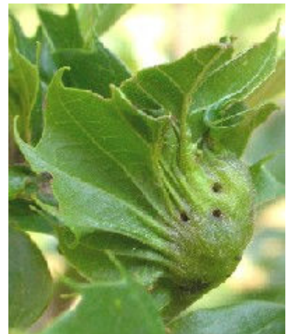
Trous d'émergence des adultes

En cas de doute sur l'identification des symptômes, qui contacter ?