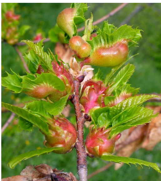
Galles sur feuilles et pétioles