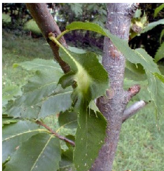
Galle sur feuille