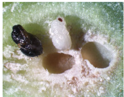
Coupe d'une galle avec nymphes

LNPV unité d'entomologie ENSAM-INRA zoologie 2, place Viala 34060 Montpellier cedex 1