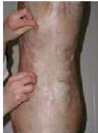
Note 4 – Gras très mou

Le gras de couverture est mou sur la totalité de la carcasse. Sur la selle et le pourtour de la queue, une pression normale du doigt laisse une déformation marquée qui persiste pendant quelques instants. Le gras est préhensible au niveau du dos mais ne l'est pas sur la selle et le pourtour de la queue.