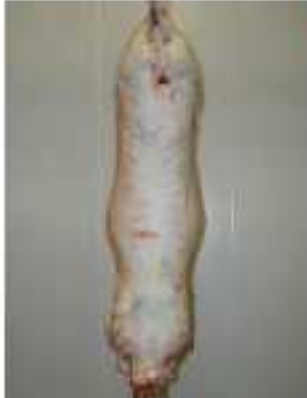
Note 1 – Gras blanc