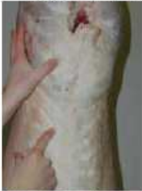
Note 1 – Gras très ferme

De gauche à droite : notes 1 à 4 – Gras très ferme, ferme, mou et très mou