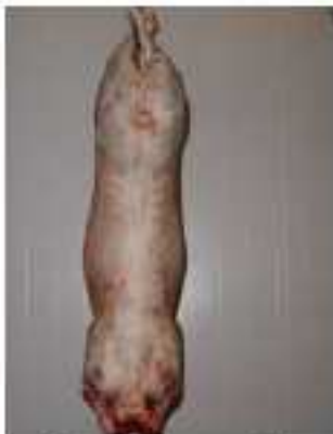
Note 3 – Gras coloré

Le gras de couverture est très légèrement coloré sur une partie de la carcasse.