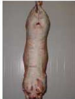
Note 2 – Gras légèrement coloré

Le gras de couverture est blanc sur la totalité de la carcasse.