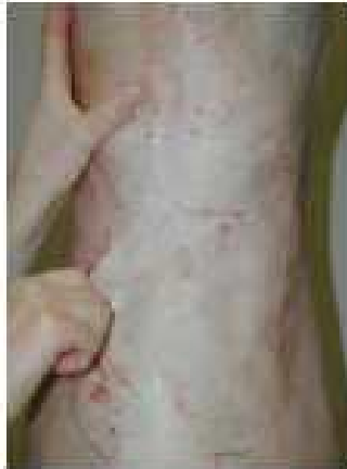
Note 3 – Gras mou