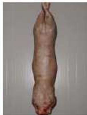
Note 4 – Gras très coloré

Le gras de couverture est coloré sur toute la carcasse ou plus fortement coloré sur une partie seulement de la carcasse.