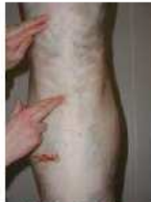
Note 2 – Gras ferme

Le gras de couverture est ferme sur la totalité de la carcasse. Une pression normale du doigt n'entraîne pas de déformation du gras.