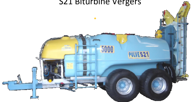
S21 Biturbine Vergers