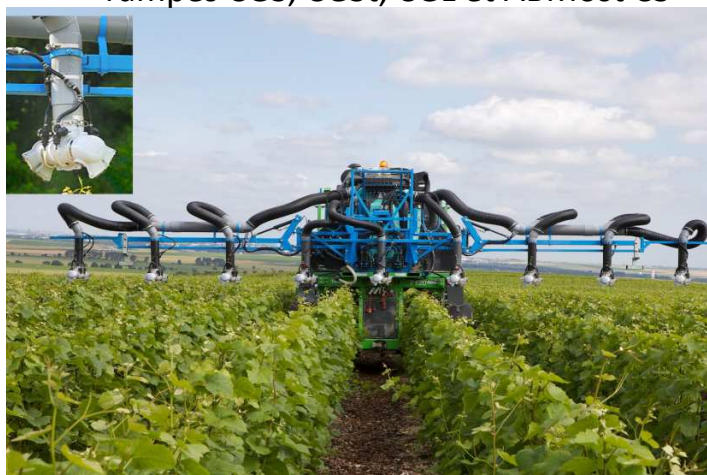
BERTHOUD Rampe CG équipant les rampes CGS, CGSt, CGL et ABMost CS