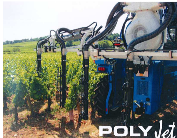
BOBARD – descentes Polyjet