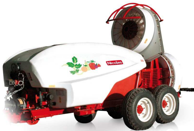
NICOLAS AirOne ADSD