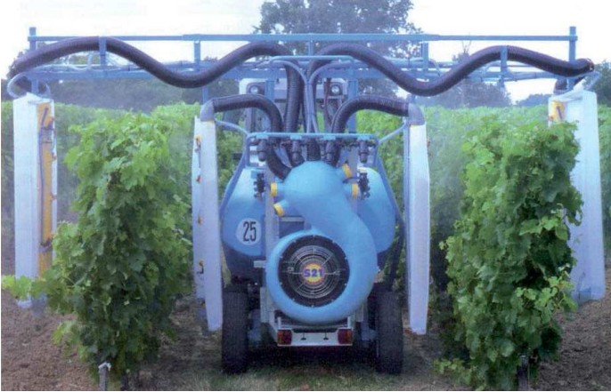
S21 tunnel de pulvérisation