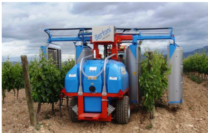
BERTONI – Arcobaleno