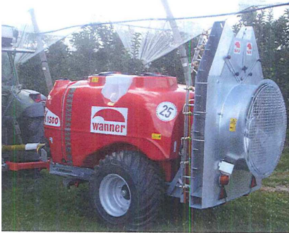
WANNER KA 32