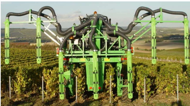
TECNOMA descente Precijet