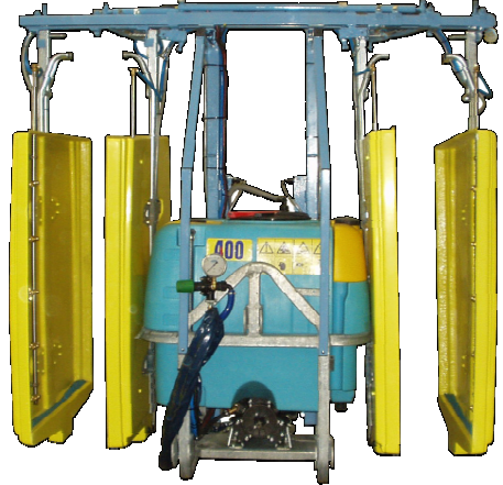
S21 Panneaux récupérateurs