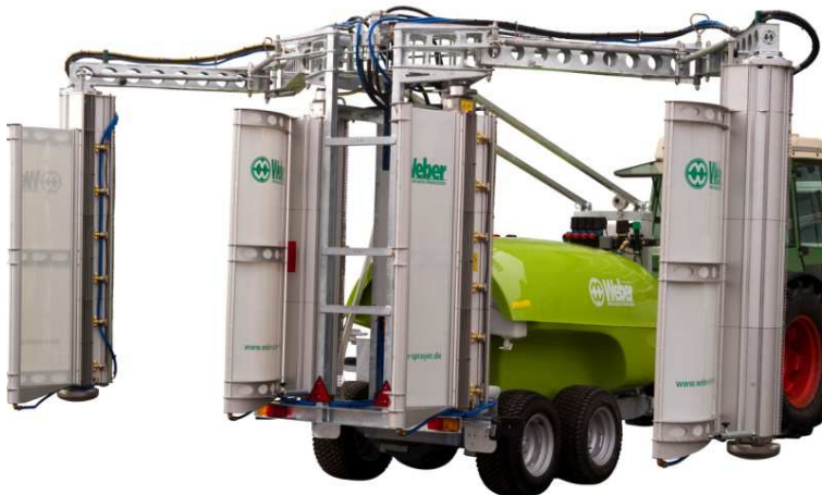
WEBER – panneaux récupérateurs