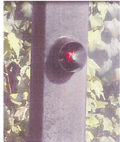
VERMANDE Boomair viti