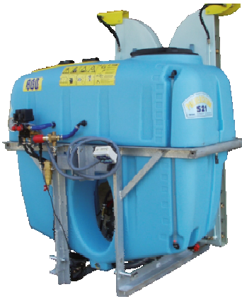
S21 Simple turbine voûte droite